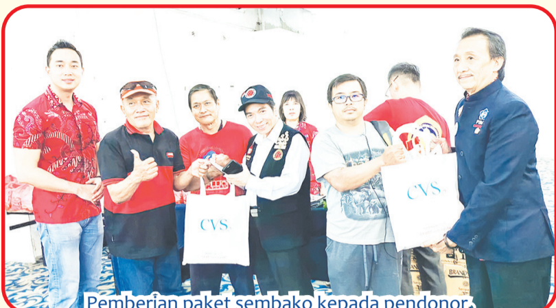
Pemberian paket sembako kepada pendonor.