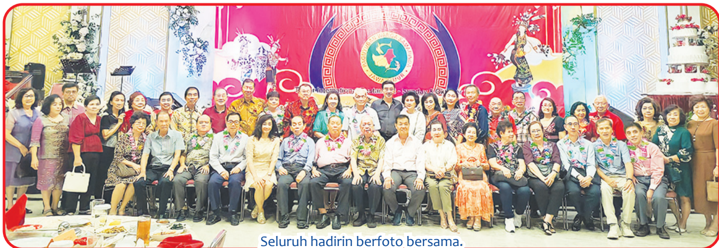
Seluruh hadirin berfoto bersama.