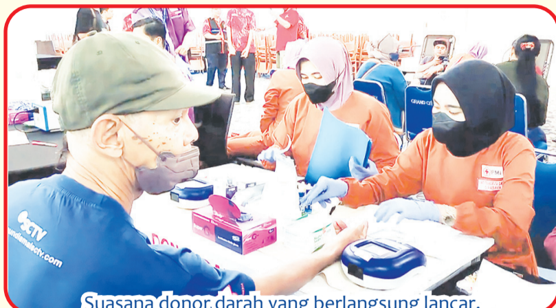
Suasana donor darah yang berlangsung lancar.

SURABAYA (IM) - Merayakan HUT ke-25, PSMTI (Paguyuban Sosial Marga Tionghoa Indonesia) menggelar aksi donor darah serempak se-Indonesia. Aksi ini digelar bertahap selama 25 hari, 21 September - 15 Oktober 2023. Ikut serta dalam aksi tersebut, PSMTI Jawa Timur yang menggelar aksi donor di Multifunction