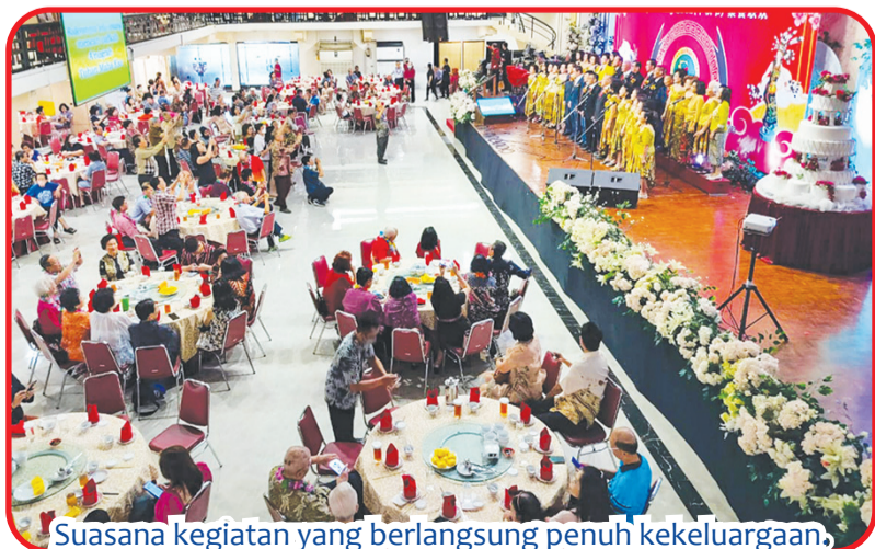
Suasana kegiatan yang berlangsung penuh kekeluargaan.