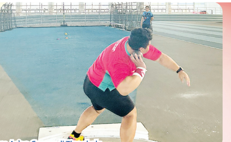
PT. Dexin Steel Indonesia mensponsori pelatihan dan pemusatan tim atletik Indonesia sebelum Asian Games di Tiongkok.