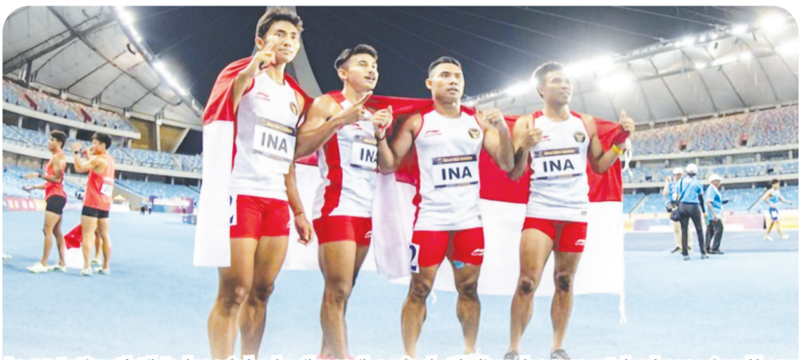
Anggota tim atletik Indonesia berhasil meraih peringkat kelima dan mencetak rekor nasional baru.