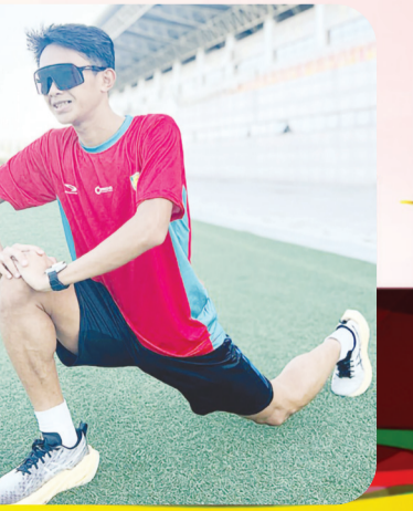
PT. Dexin Steel Indonesia mensponsori pelatihan dan pemusatan tim atletik Indonesia sebelum Asian Games di Tiongkok.