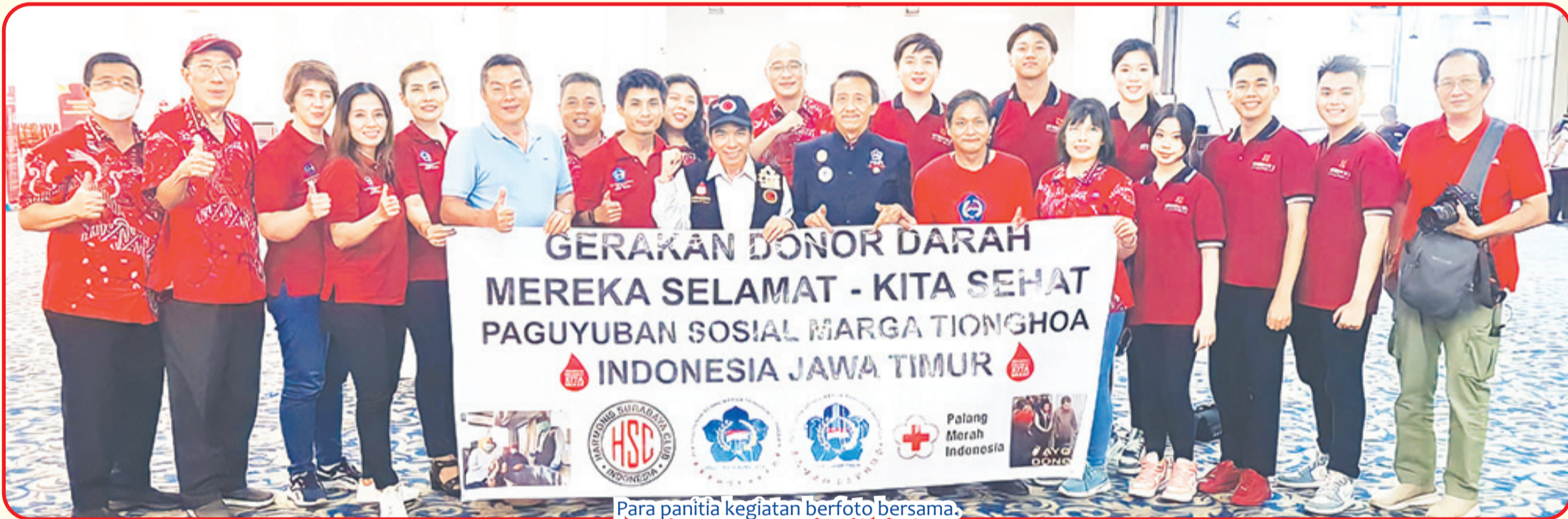
Para panitia kegiatan berfoto bersama.

donor warga Surabaya mengaku senang ikut donor darah. "Ini adalah donor darah saya yang ke sembilan. Sebelumnya saya takut donor darah. Tapi setelah tahu manfaatnya, jadi rajin donor darah. Dengan donor darah secara rutin, maka tubuh akan semakin sehat. Karena terjadi regenerasi sel-sel darah merah secara rutin," ungkapnya. ● anto tze/evi